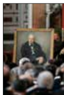
A címlapon: Fra' Andrew Bertie boldoggá avatási eljárásának kezdete

Jótt Találkozások fagypont alatt 16. oldal