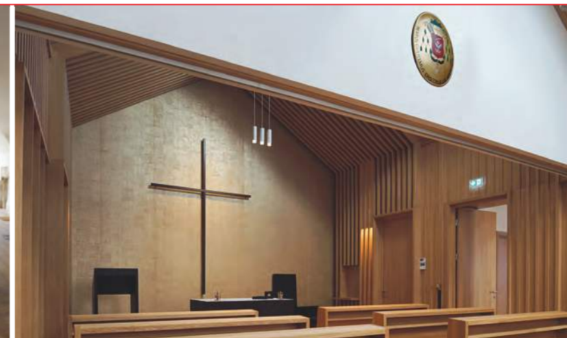
A tetőtérben nagyobb rendi kápolna és előadóterem létesült.