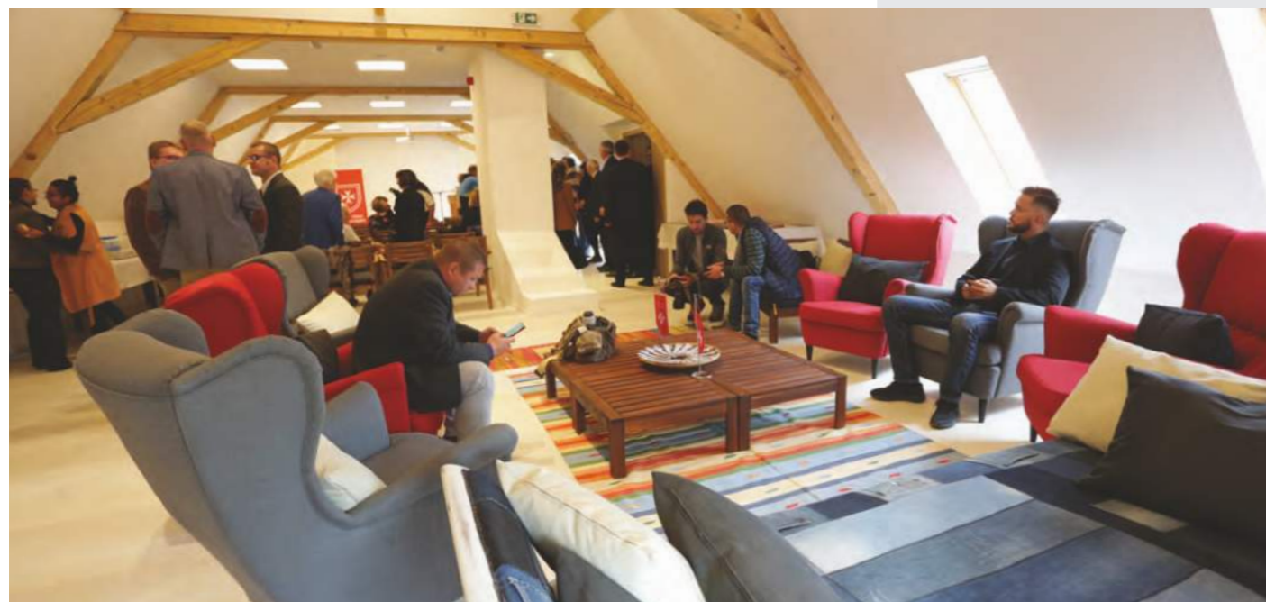
A pécsi régióközpont megújult tetőtere rendezvényeknek is otthont ad.

Az infrastrukturális fejlesztések kapcsán Soltész Miklós, a Miniszterelnökség egyházi és nemzetiségi kapcsolatokért felelős államtitkára elmondta, 6+3 karitatív szervezetet támogatott a kormány 4,5 milliárd forinttal, ebből több mint 600 millió forintot kapott a Máltai Szeretetszolgálat a raktározási és adminisztratív feladatoknak helyet adó ingatlanok felújítására. „Azért fontosak ezek a felújítások, mert a karitatív tevékenység nem maradhat a háttérben. Nagyon jó érzés tudni, hogy olyan épületek újulnak meg és épülnek, ahonnan egy tragédia esetén azonnal el tudják érni a bajban lévő embereket, azonnal tudnak segítséget nyújtani.” – szögezte le az államtitkár.