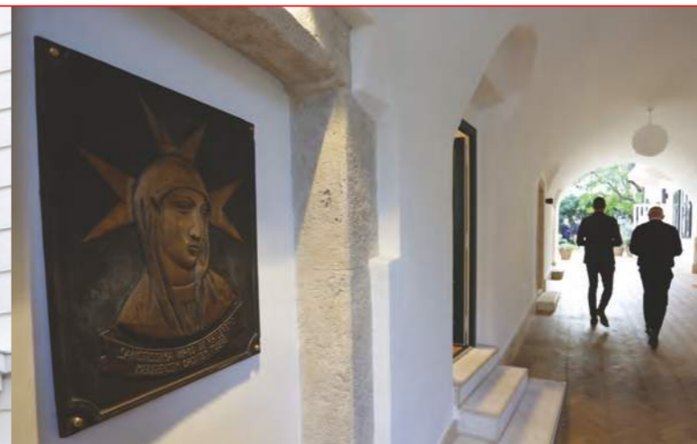
A Rend magyarországi hazatérése 1987-ben karitatív cselekedetekkel kezdődött, és 1996-ban a hivatalos bejegyzéssel zárult.