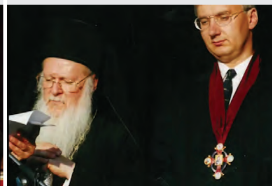
I. Bartholomaiosz pátriárka és Semjén Zsolt (2000)

Két bolgár egyházközség a budapesti parókus vezetése alatt. Főhatósága a szófiai patriarchátus.