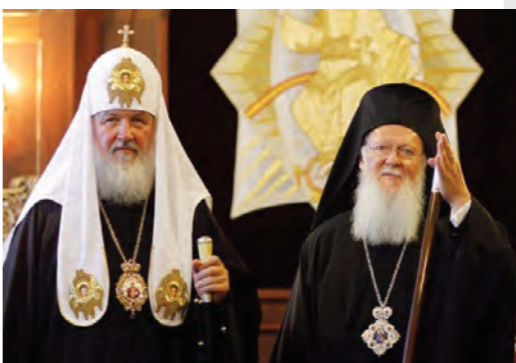
Kirill moszkvai pátriárka, valamint I. Bartholomaiosz konstantinápolyi pátriárka

Az 1917-es bolsevik puccs miatt nagyon sok ukrán elhagyta hazáját.