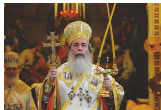
III. Theophilos jeruzsálemi görög ortodox pátriárka

Az egyház hívei ma elsősorban Szerbiában, Montenegróban, Bosznia és Hercegovinában, Horvátországban, Szlovéniában, Romániában, Európa több államában,