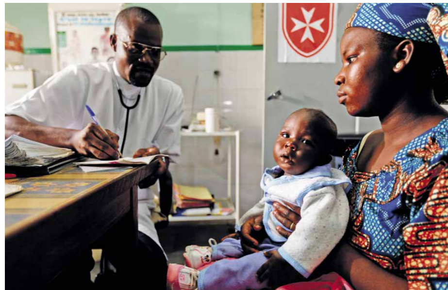
Máltai egészségügyi központ Kamerunban

– Mert még szükség van a segítségre. Haiti a régió legszegényebb országa.