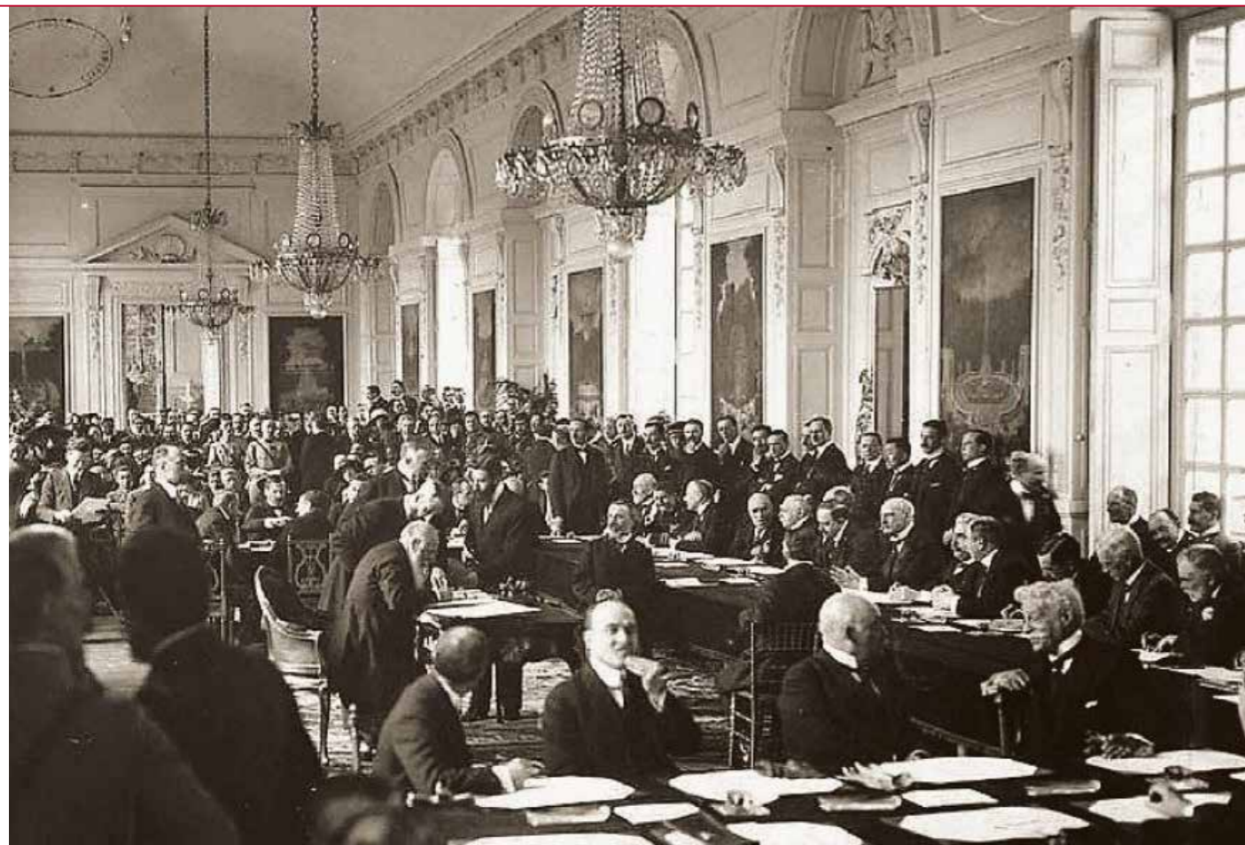
A magyar békeszerződés aláírása a Nagy-Trianon palota Cotelles termében (1920. június 4.)