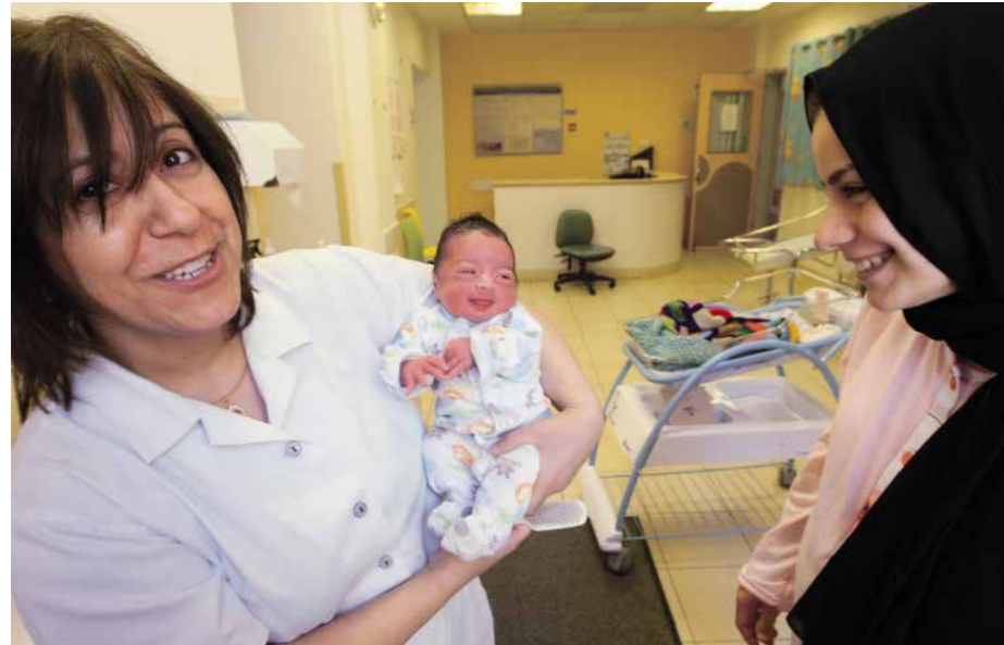
Egy a nyolcvanezer csecsemőből

– A Haiti szigetén 2010 januárjában pusztító földrengés egész városrészeket semmisített meg, az áldozatok száma meghaladta a 170 ezret. Óriási összefogással szerveződött a nemzetközi segítség, ám amikor a katasztrófa lekerült a címlapokról, a segítők is eltűntek a szigetről. Nyolc év után még mindig emberek tízezrei élnek táborokban, de a nemzetközi alakulatok közül ma már szinte csak a máltaiak radtak velük. Miért vannak még ott?