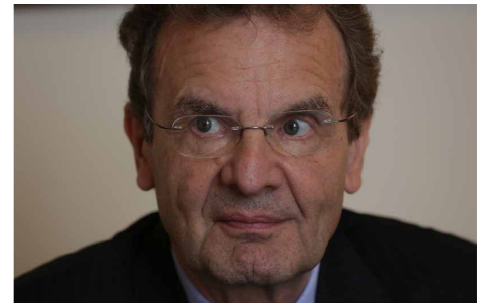
Fejlődésünk legragyogóbb példájának lehettem tanúja Magyarországon

intézmény, de mint vallási rend a Katolikus Egyház része.