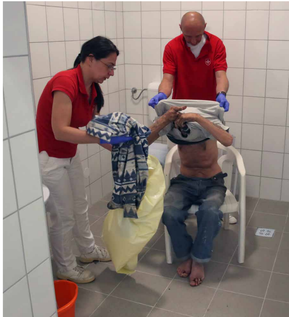
Mintha nem csak a ruhájukat cserélnék ki

A fővárosi fertőtlenítő fürdető állomást hosszú időn át az ÁNTSZ működtette a Váci úton, 2012-ben azonban az intézményt bezárták. A hajléktalan ellátásból hiányzó szolgáltatást 2013 áprilisában a Magyar Máltai Szeretetszolgálat indított