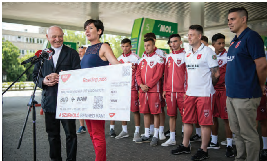
A csapat a MOL támogatásával utazott el a világbajnokságra

„A háromnapos edzőtáborban volt szakmai felkészülés, ismerkedés és itt hit-