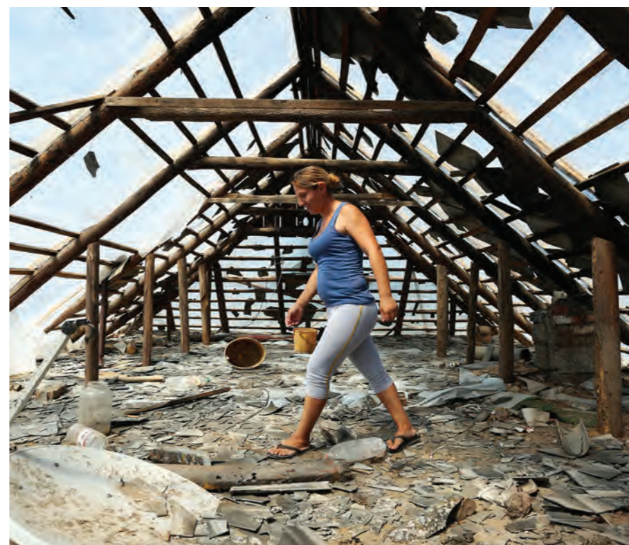
Volt, ahol már a katasztrófa után kifeszített fóliát is cserélni kellett.