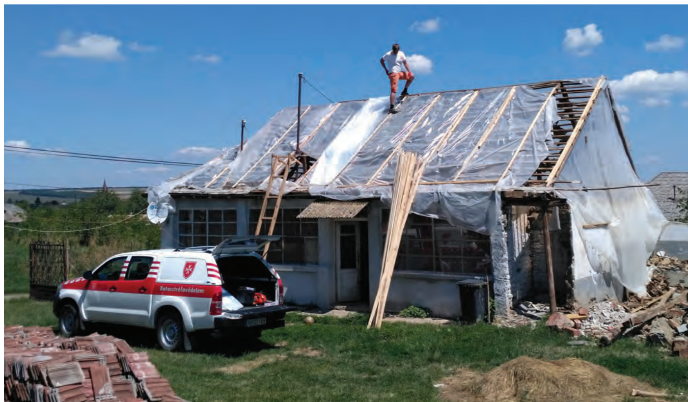
A Szeretetszolgálat mintegy két tucatnyi ház tetőfelújításához járult hozzá