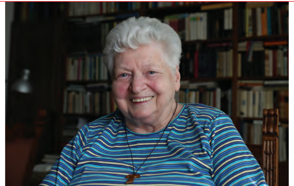
„Én a börtönben csak kaptam”