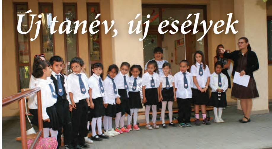
Első nap a gyulai iskolában

A Magyar Máltai Szeretetszolgálat négy óvodát, négy általános iskolát és négy szakképző intézményt működtet. A karitatív szervezet által az elmúlt években átvett nehéz helyzetű általános iskolák szakmai munkája megerősödött, a tanulmányi eredmények jelentősen javultak, a bukások visszaszorultak, az iskolát elvégzők pedig egyre nagyobb arányban tanulnak tovább.