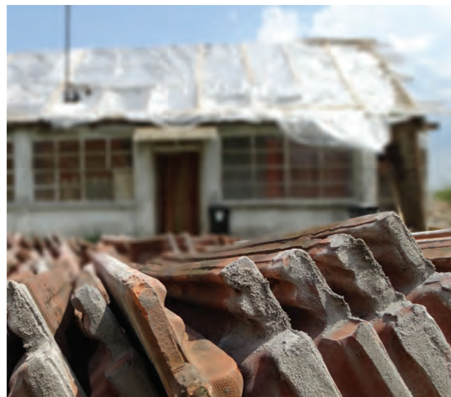
Sokan hónapokig éltek a lefóliázott házakban