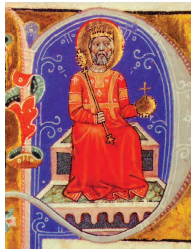
Szent István a Képes Krónikában

Múltunkat nem adjuk, jelenünket a múltunkba gyökereztetjük, a jövőnket a szentistváni örökség szellemében formáljuk!